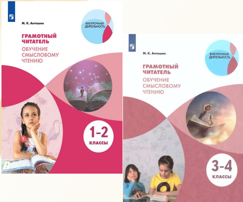
М. Антошин. Грамотный читатель. Обучение смысловому чтению